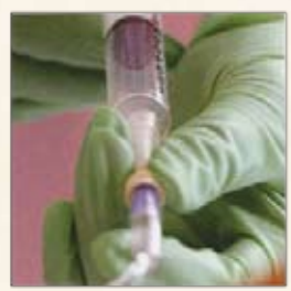
Sealing & Shielding