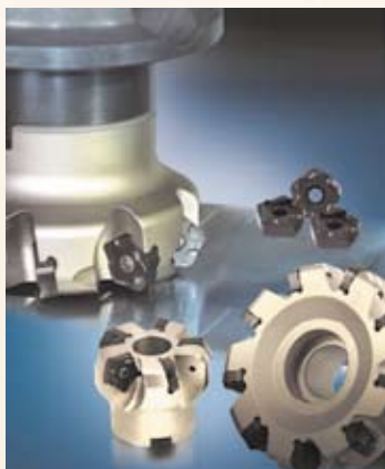
FMD02 鋳物用フライスカッター