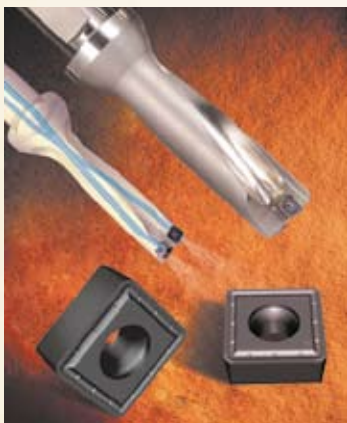
ZTD 刃先交換式ドリル