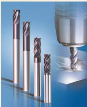
VSM 不等リード不等ピッチエンドミル