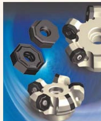
FMA07 マルチコーナー型