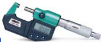
デジタルマイクロメーター